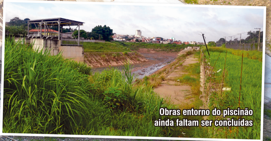
Obras entorno do piscinão ainda faltam ser concluídas